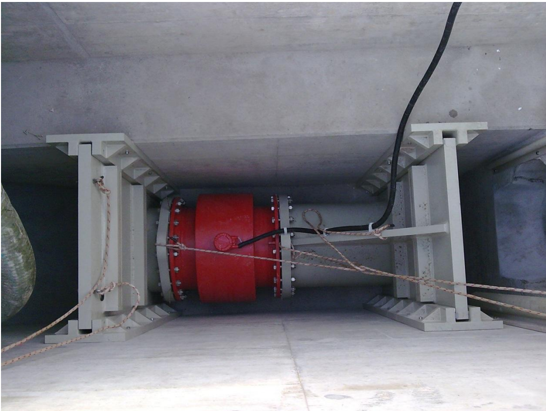
Stationäre Abwasser- Durchflussmessung der Stadt Kloten ZH

Das Magnetisch Induktive Messverfahren ermöglicht eine präzise Mengenerfassung über das gesamte Mess- Spektrum. Mit der Einbaukonstruktion von STEBATEC kann das MID unter Wartungsfreundlichen und Betriebssicheren Bedingungen in der Kanalisation betrieben werden. Zudem erlässt die STEBATEC auf der Messstation eine Genauigkeitsgarantie die den Parteien Sicherheit für korrekte Kostenabrechnung gibt.