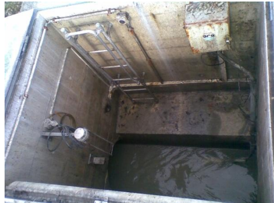
Bestehender Messschacht mit Echolot

Die Messanlage soll Wassermengen zwischen 20 l/s bis 550 l/s präzise messen können.